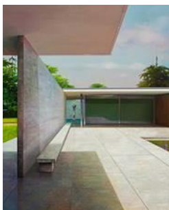
Avantgarde House © Jens Hausmann, lumas.com

Die Werke von Jens Hausmann spiegeln seine Faszination für Raum, Landschaft und Perspektive wider. Puristische Bauten werden in einem Spiel aus Schatten und Licht gekonnt in Szene gesetzt. Freischwebende Terrassen, Garagenvorplätze, große, bis zum Boden reichende Fenster oder Gärten mit großzügigen Swimmingpools sind besonders kennzeichnend. Selten sind die Bewohner der spektakulären Häuser zu sehen, dafür Details wie Sonnenliegen oder Autos, die die Lebensweise erahnen lassen. Die klare architektonische Formensprache lässt den Einfluss des Bauhaus der abgebildeten modernen Bauten erkennen.