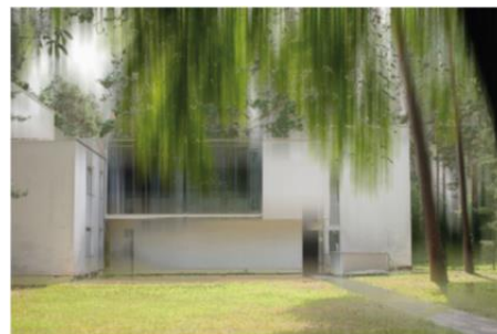
Bauhaus Dessau II

Die neuen Werke „Bauhaus Dessau II“ und „Bauhaus Dessau III“ sind ab April erhältlich. Die Fotografien werden ab 499 Euro und ab einer Größe von 60 x 90 cm angeboten.