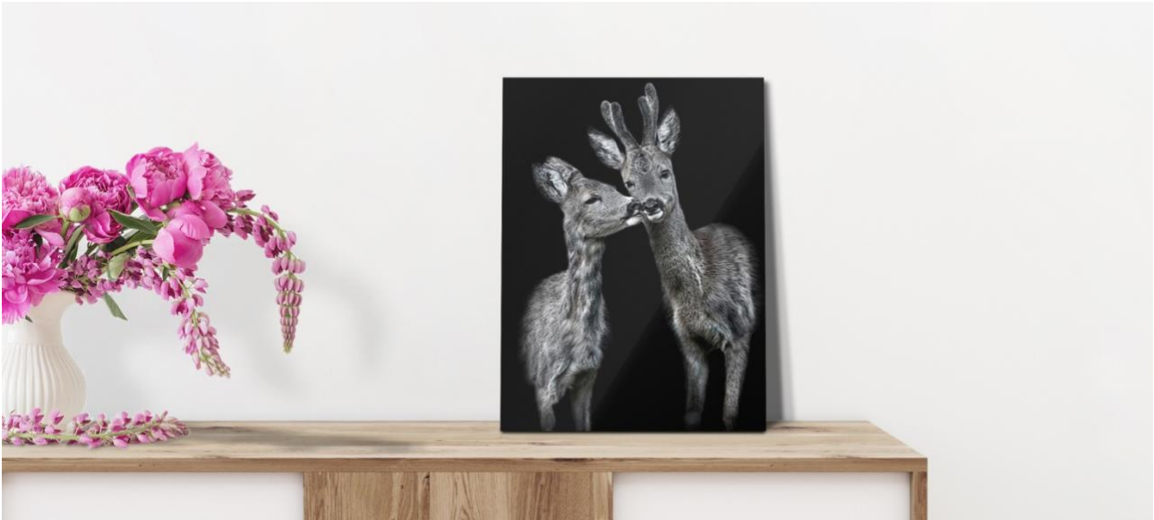
Der Kuss