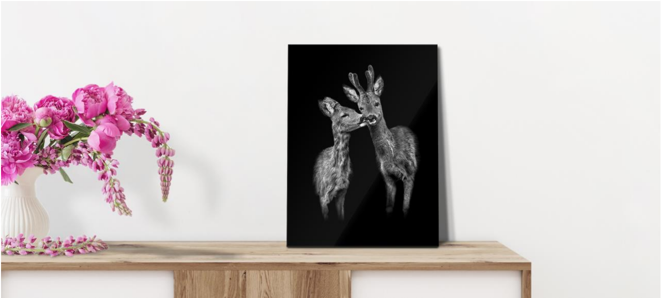
Der Kuss