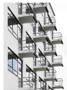
Bauhaus II

Die neuen Werke „Bauhaus“ und „Bauhaus II“ sind ab April verfügbar.