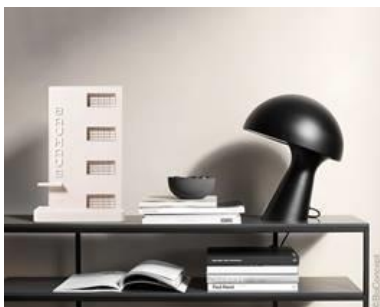
Bauhaus Dessau

Berlin, 05. März 2019 – Das Bauhaus zählt noch immer zu den bedeutendsten Kunstschulen, die Architektur und Design der Moderne bis heute nachhaltig beeinflusst. Getreu dem Motto „form follows function“ entstanden zahlreiche Designklassiker und architektonische Highlights. Zum 100-jährigen Jubiläum präsentiert die Editions-galerie LUMAS Kunstwerke, die sich der Bauhaus-Architektur widmen, abstrakt, detailgetreu oder als Miniaturmodell.