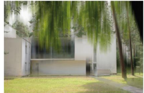
Bauhaus Dessau II

Die neuen Werke „Bauhaus Dessau II“ und „Bauhaus Dessau III“ sind ab April erhältlich. Die Fotografien werden ab 499 Euro und ab einer Größe von 60 x 90 cm angeboten.